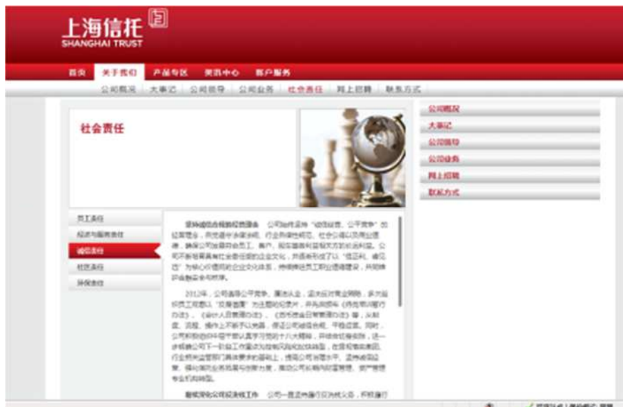
图 16:上海信托网站开设专业板块，披露公司社会责任工作履行情况

上海信托一直将履行企业社会责任作为一项重要战略举措和对社会的郑重承诺，积极贯彻国家政策，服务广大客户，强化公司治理，弘扬卓越文化，支持公益事业，帮助弱势群体，保护生态环境，推动经济社会环境健康协调发展，与利益相关方携手促进社会和谐，努力成为国内一流的资产管理和财富管理金融机构。