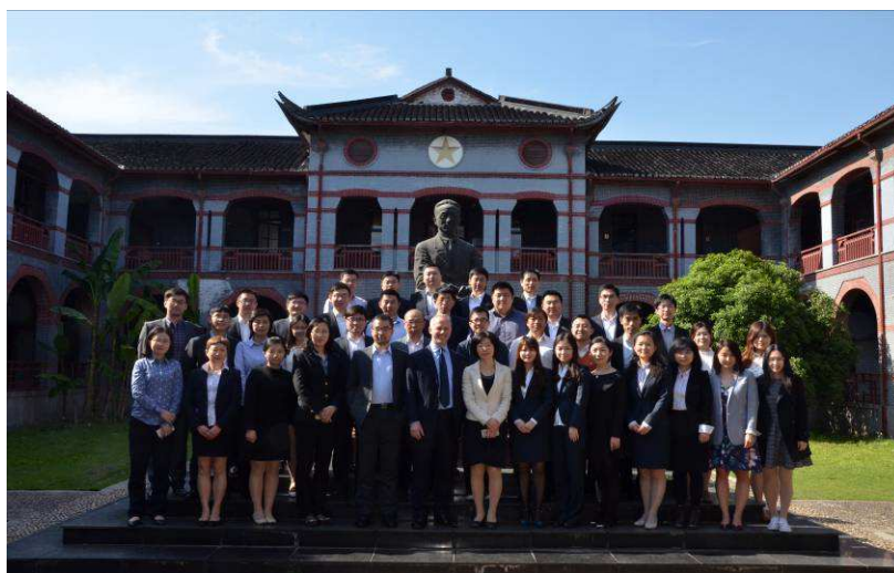
图 5：上海信托举办离岸信托理论及实务培训

托安排等大量案例。此次培训有助于员工深入了解离岸岛信托法律和政策环境、全面学习海外信托的不同类型和架构，为公司家族信托业务发展、海外财富管理平台建设、离岸配置能力提升，提供了有益的借鉴。