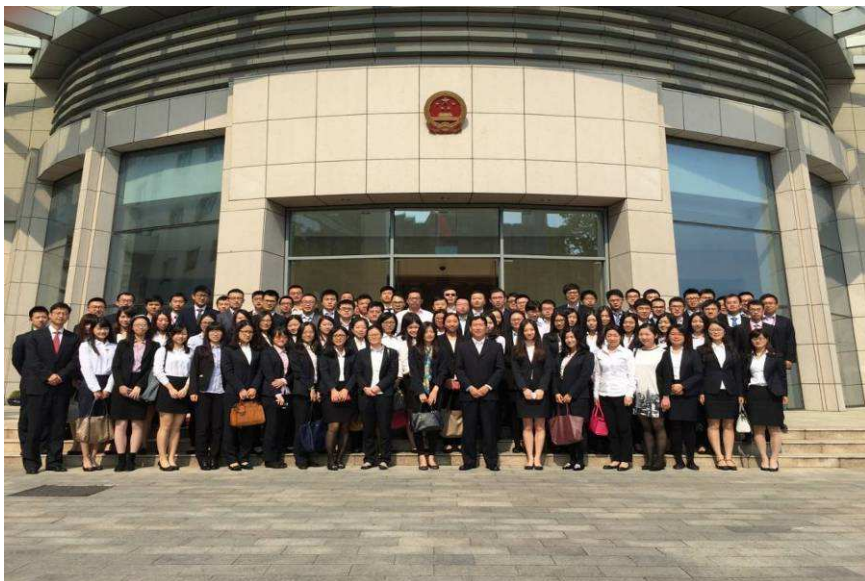
图 8：上海信托组织青年员工行为管理主题教育活动

随后，公司党办向广大青年员工传达了公司党委关于加强青年员工对银监会职业操守指引和公司员工手册学习领会的具体要求，要求全体青年员工要从行为细节入手，严格管控个人行为，杜绝内幕交易、利益输送等禁止性行为，营造风清气正的工作氛围