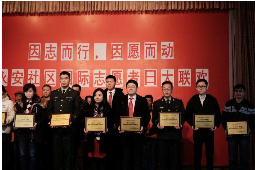
图 14: 上海信托志愿者服务队荣获社区优秀志愿者服务队称号