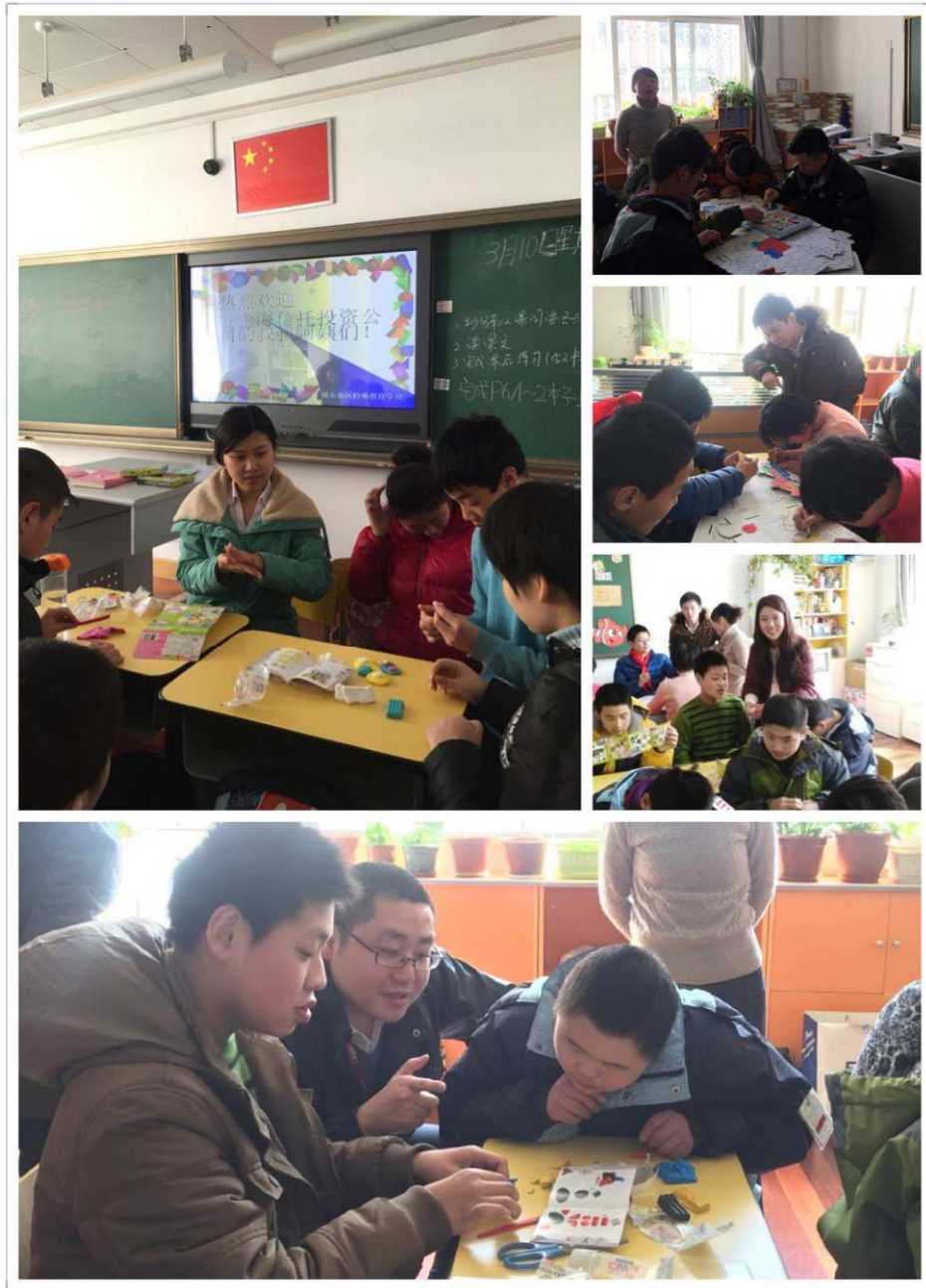
图 11: 上海信托组织特殊儿童陪伴活动