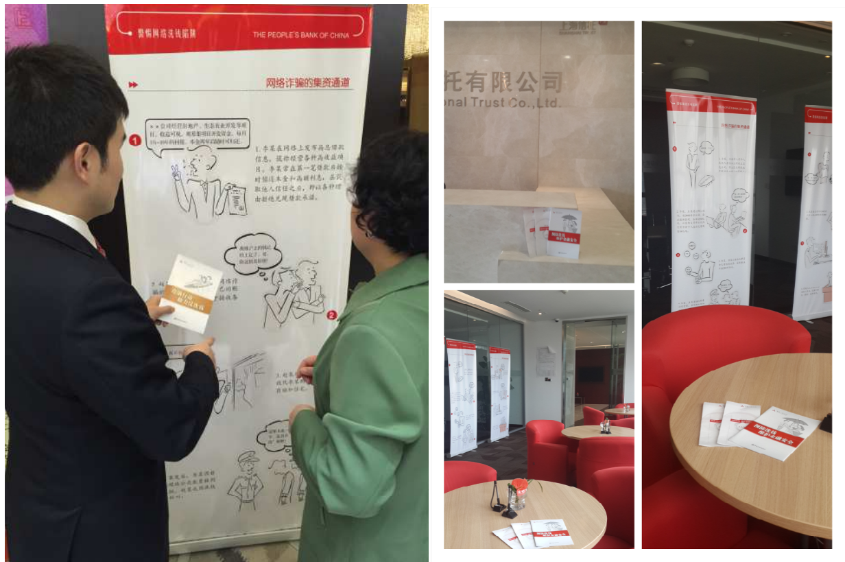
图 7: 在财富管理总部及个营销网点拜访人行下发的宣传手册和折页