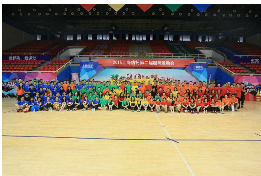
图 2：上海信托举行第二届员工趣味运动会

二季度活动在热烈、欢乐的气氛中落下帷幕。公司全体员工将怀着饱满的斗志、昂扬的精神，走上下半年业务营销竞赛的新征程。