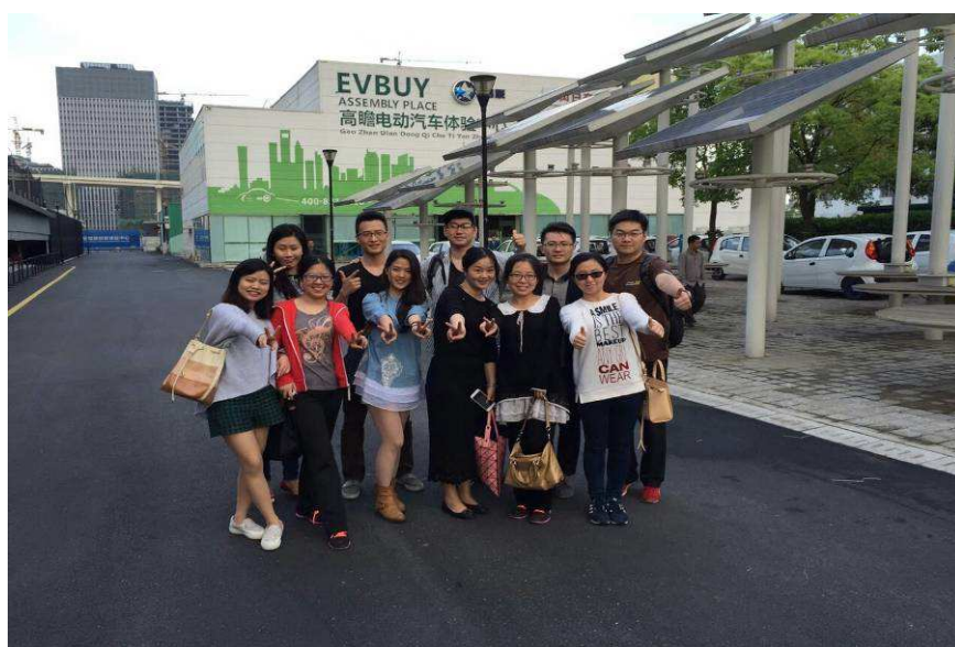
图 1：上海信托团总支组织“五四”青年科技参观活动

通过此次活动，团员青年们对于新能源技术有了更直观和深入的认识。他们相信，在新技术创造和新商业力量的共同影响下，低碳出行理念的全面践行将不会是一个遥远的梦。