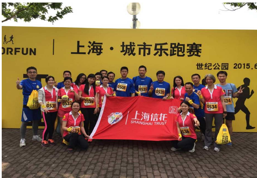
图 3：上海信托参加“2015 上海城市乐跑赛”

通过此次乐跑活动，公司跑者拥抱跑步文化、践行健康理念，今后，他们将以更阳光、更乐观的心态投入到工作和生活中，将“乐跑精神”发扬光大。