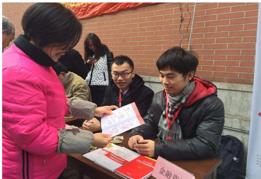
图 10: 上海信托举办“金融咨询进社区”志愿服务活动