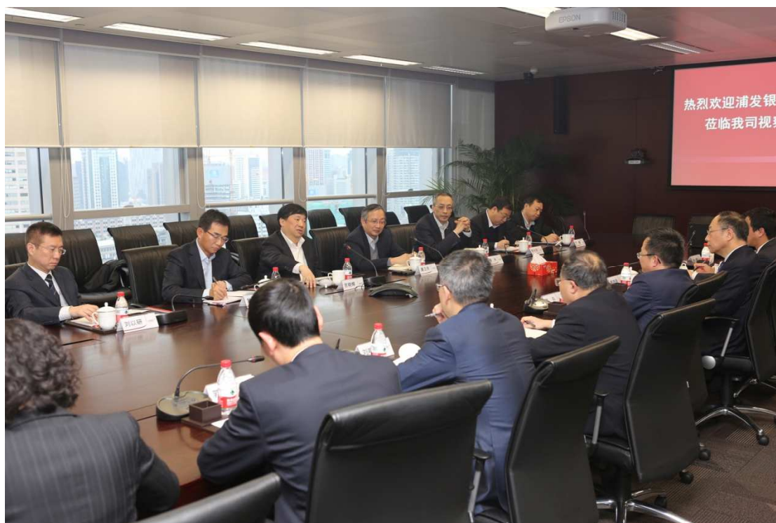
图 17：浦发银行董事长吉晓辉一行调研上海信托

上海信托的转型发展，做到优势互补、互惠共赢；三是要围绕整合目标相互配合平稳渡过磨合期，更好地融入浦发银行，近期要尽快完成收购交易等活动；四是要加强浦发银行和上海信托的业务协同发展，深化合作交流，增强联动协同效应；五是要继续推进市场化机制改革，努力打造一支市场化、有竞争力的信托团队。