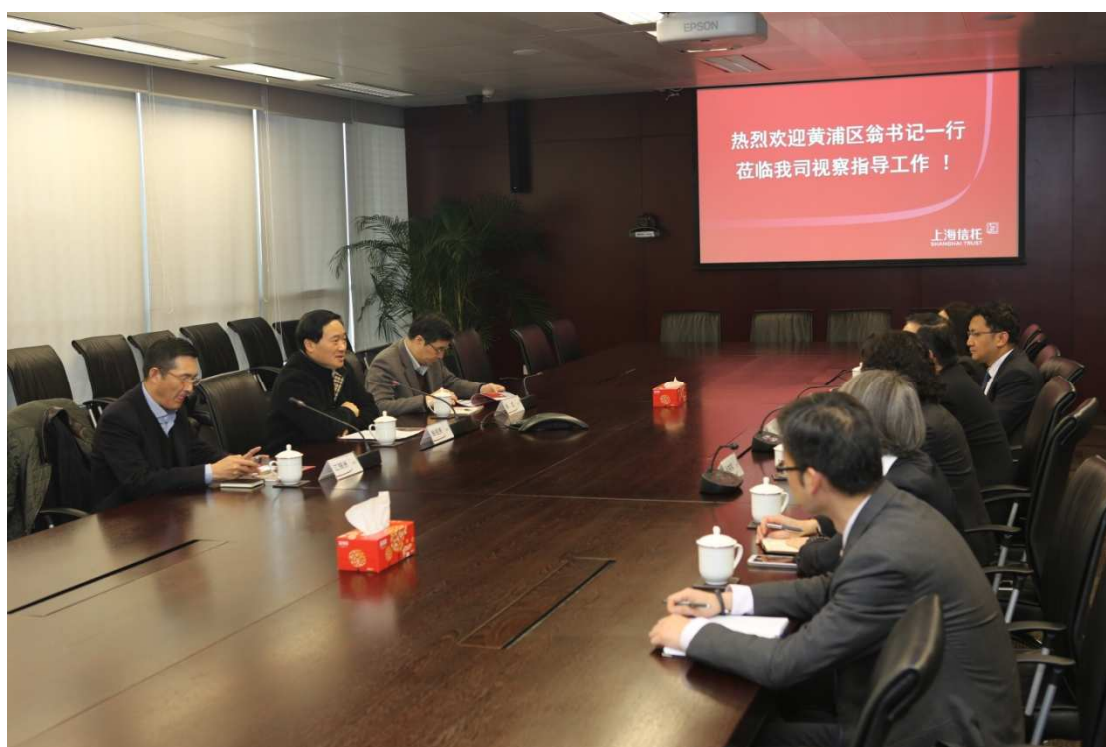
图 18: 黄浦区委书记翁祖亮一行调研上海信托

3月4日下午,黄浦区委书记翁祖亮赴上海信托调研,区委常委、副区长吴成,区金融办主任江锡洲等陪同调研。上海信托董事长潘卫东及公司班子有关成员参加会议。潘卫东董事长向翁书记一行介绍了公司基本情况、业务特点、下一步工作思路及需要支持的事项。翁祖亮书记充分肯定了上海信托近年来取得的成绩,对公司为黄浦区社会经济发展做出的贡献表示衷心感谢,并表示黄浦区将在金融产业政策等方面为上海信托提供更好的服务。