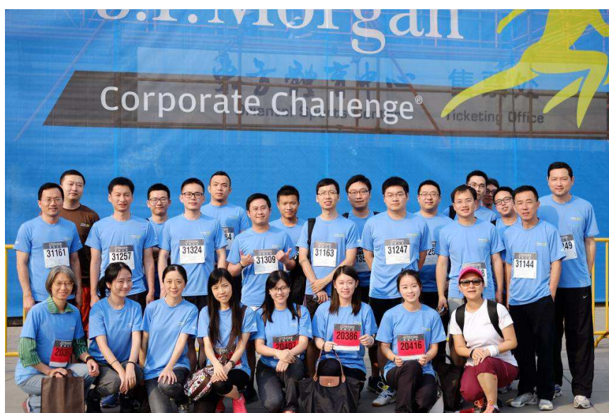
图 4：上海信托参加“2015 摩根大通企业竞跑赛”

今年是公司连续第三年组织员工参加摩根大通竞跑赛。今后，公司将一如既往组织各类跑步活动，参与员工个人健康管理进程，推动形成健康、积极、快乐的上信人精神状态