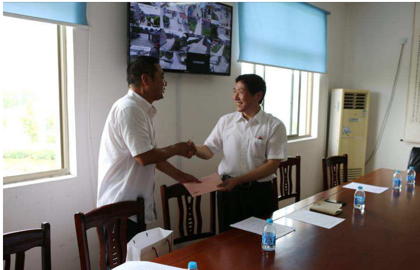
图 12：上海信托开展四团村城乡党组织帮扶活动

四团村是我司城乡党组织结对帮扶对口村。自 2013 年底签订结对帮扶协议以来，公司积极履行帮扶责任，每年走访慰问困难家庭，访贫问苦，替困难群众分忧解难，所捐赠的慰问金、慰问品，已累计惠及 238 人次。今后，公司将一如既往资助四团村困难群众，为四团村脱贫致富事业做出应有的贡献。