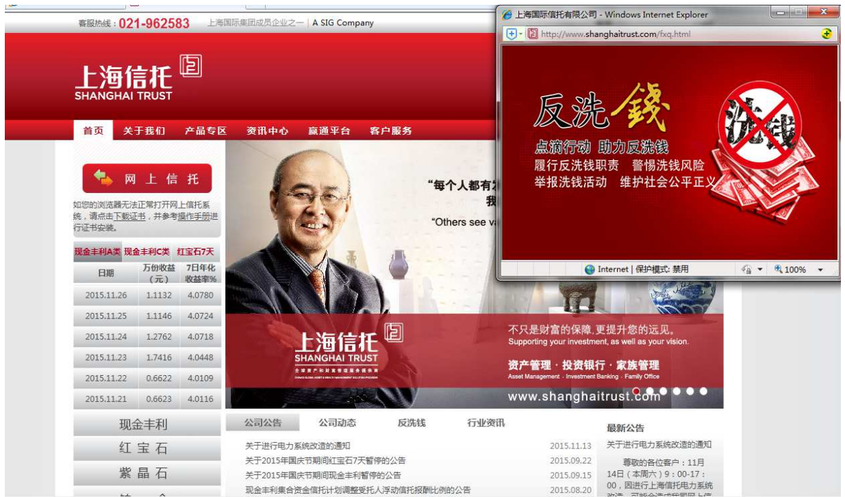
图 6: 反洗钱宣传照片