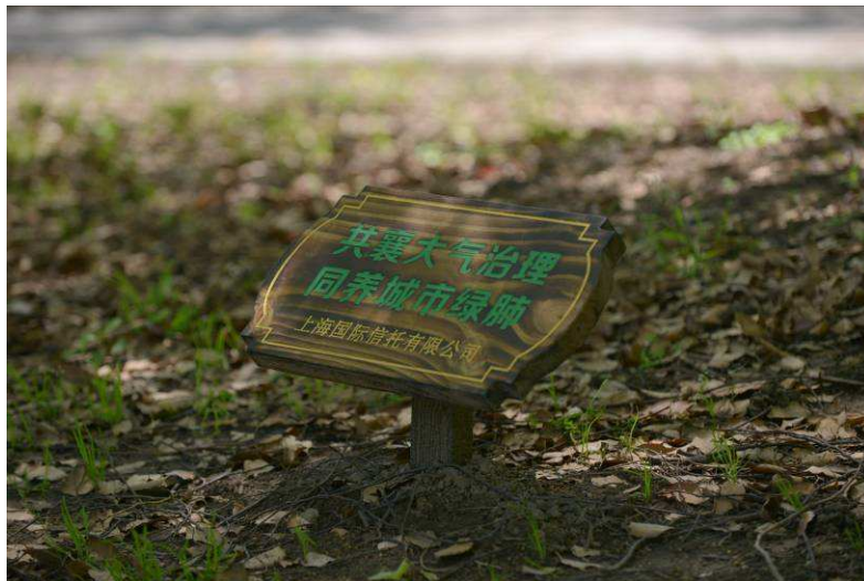
图 15: 上海信托参加市民绿化节树木认养活动

通过此次活动，公司青年员工共享了热心社会公益、遵守社会公德、积极奉献社会的精神，公司也展现了积极履行社会责任的良好社会形象。今后，上海信托将一如既往，秉持“心系社会，服务社会，回馈社会”的社会责任理念，为上海城市建设和社会治理积极贡献力量。