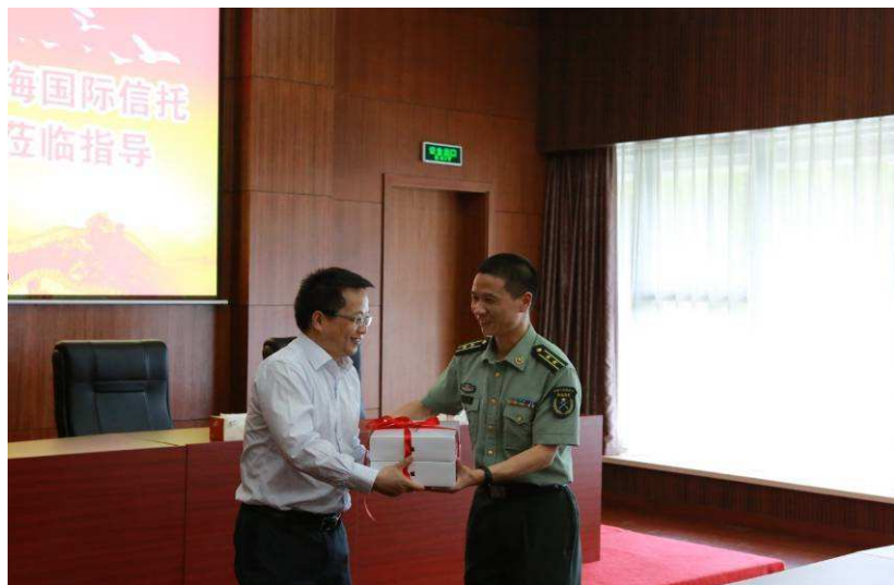
图 13：上海信托与南京路好八连开展军企共建活动

军企互动共建是我党、我军的优良传统，也是企业履行社会责任的重要组成部分。结对十年以来，公司不断将业务开拓与拥军共建紧密结合起来，突出“思想共建、双向奉献、优势互补、共促双赢”的工作思路，通过缔结军企共建的牢固纽带，不仅为加强部队建设尽义务，也推动了公司精神文明建设的健康发展。