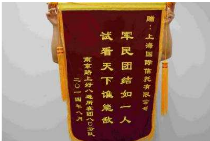
图 40 南京路上好八连所在团八〇分队向上海信托赠送锦旗

积极参加义务献血活动 上海信托积极推广自愿无偿献血，做好组织、宣传和动员工作，切实落实无偿献血任务。每年都按时足额完成义务献血任务。2014年8月，上海信托按照黄浦区人民政府下发的《关于做好2014年黄浦区无偿献血工作意见的通知》精神，组织14名员工赴上海市血液中心参加了2014年度公民无偿献血，奉献了爱心，履行了公民应尽的义务。公司主动关心献血职工的健康，合理