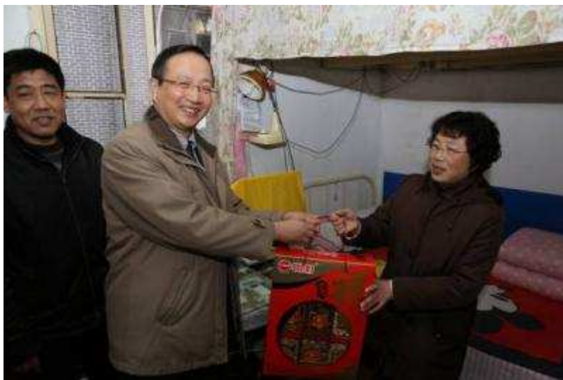
图 31 上海信托开展爱心结对对象新春慰问活动

持续开展“一手牵小、一手扶老”双结对工作 上海信托多年来持续开展“一手牵小、一手扶老”双结对工作，使之成为持之以恒的帮困、助学活动。上海信托以党支部为单位，每个支部与一名生活困难的老人和一名贫困学生进行结对，通过定期上门慰问、交流、赠送学习用品、生活用品等方式，关心工作学习，解决生活问题，深入到最广大群众了解他们的所需所急。2013、2014 年公司共举行 4 次扶贫帮困双结对活动，共帮助 10 户对象，相关扶贫帮困活动已实现常态化。开展各类结对帮扶活动，为困难群体排解民生之忧，是党的优良传统的具体体现，也是新时期深化“群众路线教育实践活动”活动和党性培养的重要举措。上海信托各支部通过坚持“双结对、走基层”，协助街道社区为帮扶困难群体送温暖、办实事、惠民生，践行群众路线宗旨，落实创先争优作风，并为一批批新进党员提供与群众面对面、心连心的党性教育平台。