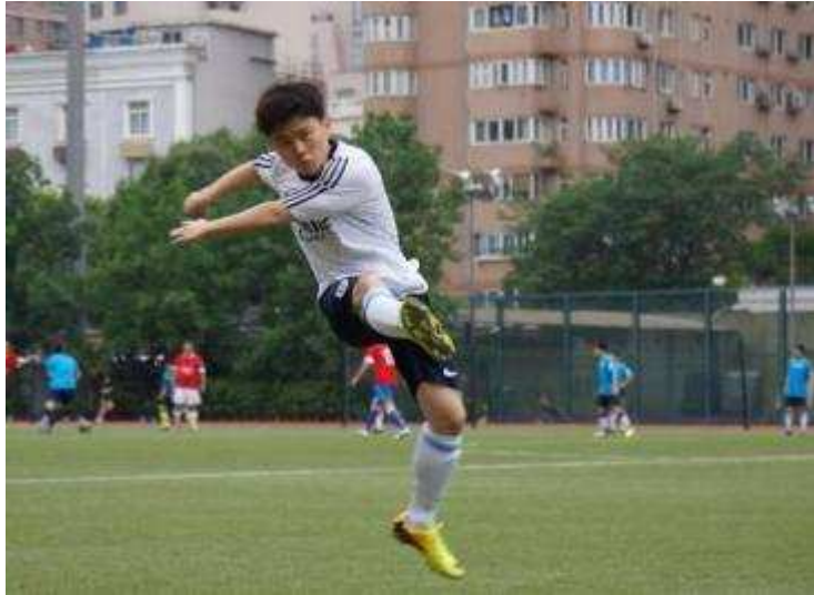
图7 上海信托参加浦发一管足球邀请赛

6月，上海信托代表队受邀参加了“第二届浦东金融青年羽毛球比赛”，在全队上下团结一致、齐心协力地共同努力之下，上海信托代表队最终杀出重围获得了团体优胜奖及混双第三名的佳绩，展现出了上海信托人阳光向上、顽强拼搏、团队协作的良好精神面貌。