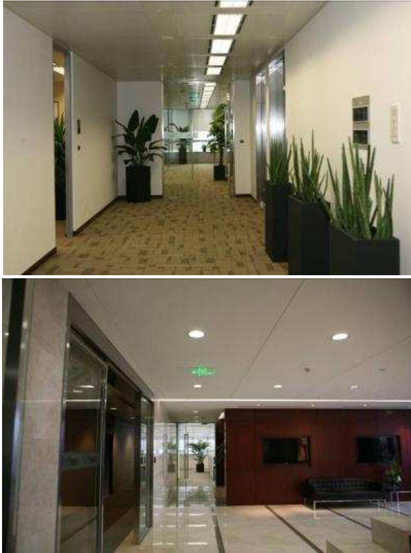
图 15 上海信托内外环境整洁优美 办公场所设计合理