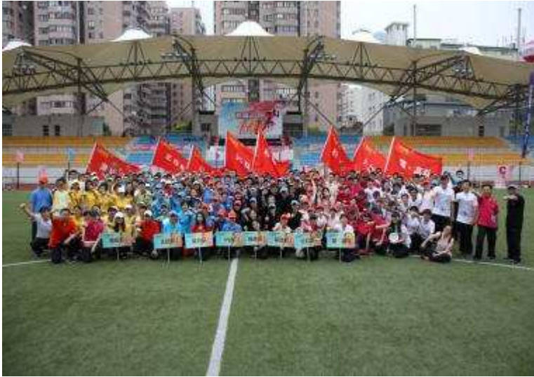
图9 上海信托举办首届趣味运动会

公司员工搭建展示自我、交流协作的良好平台。比赛过程激烈而具戏剧性，充分展示了上海信托全体员工高昂的奋斗精神和饱满的生活热情。