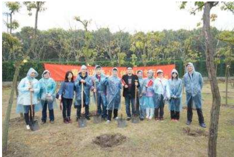
图 42 上海信托“爱护自然，马上有树”活动

“爱护自然，马上有树”植树活动 3月29日，上海信托团总支22名团员利用周末时间，来到东方绿舟开展“爱护自然，马上有树”植树活动，为去年种植的爱心树进行养护，并栽种新的树苗。部分养护和植树的钱款将通过东方绿舟，定向捐助给云南地区的先天性疾病患儿（心脏病、畸形）治疗。