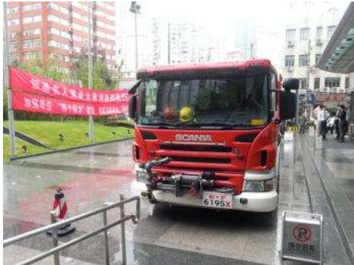
图 13 上海信托派员参加恒基名人商业大厦消防演习

9月，上海信托向公司全体员工发出“关爱生命，文明出行”倡议，呼吁员工摒弃交通陋习，并在公司宣传栏张贴了彩色宣传页。公司希望通过此次交通安全宣传活动，在全公司范围内普及交通安全知识，提升安全出行意识。