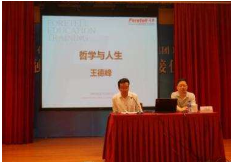
图 5 上海信托在全公司范围内举办多期人文讲座