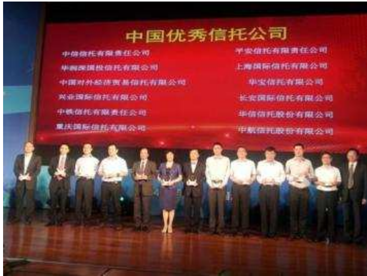
图 23 上海信托荣膺第七届中国优秀信托公司评选大奖