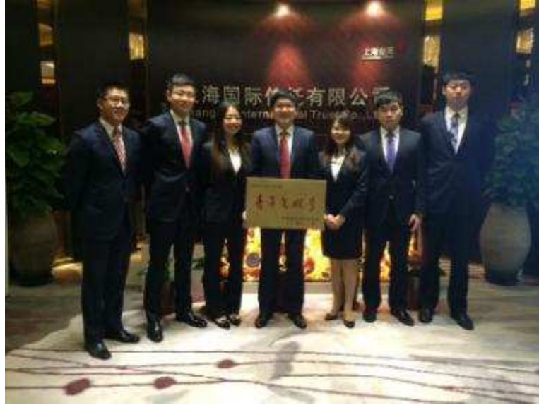
图 25 上海信托国金财富中心荣获 2013 年—2014 年度上海市“青年文明号”称号

积极参加城市公共管理，发挥专长服务市民 2014 年，上海信托成功发行上信新虹桥健康产业股权投资集合资金信托计划，并代表该信托计划作为有限合伙人加入上信健康医疗产业基金。该基金是由上海信托的全资子公司上信资产管理有限公司发起设立的，基金所募集资金专项用于投资上海新虹桥国际医学中心一期核心区的高端医疗机构。此外，基金还将与闵行区政府合作开发新虹桥医技中心，医技中心将定位于园区内一站式高度集约的医技、后勤和商务服务的共享平台，为入驻园区的医疗服务机构提供检验病理、影像诊断、药品配送、消毒供应、医疗污水处理等标准化和集约化的医技服务，同时也将提供超市零售、饮料快餐、银行保险、高端诊所、学术交流、办公展示等一系列便捷的配套服务。