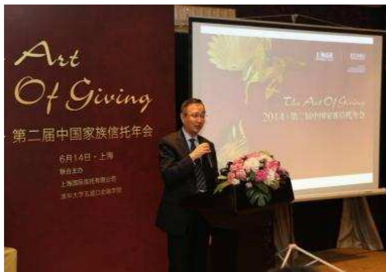
图 20 上海信托举办 2014 年第二届中国家族信托年会