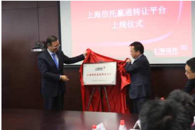
图 18 上海信托举行赢通转让平台上线仪式

受让平台，其成功上线运行是我司战略转型的重要方向，不仅可以更好地为客户提供增值服务，还将进一步扩大客户的拓展范围，为公司创造更多的盈利空间。