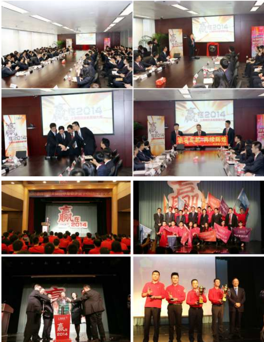
图 17 “赢在 2014——上海信托业务营销大赛”

引入竞争激励机制，提升营销市场化水平 根据公司建立市场化绩效考核机制，进一步做大做强直销业务的发展思路，公司出台了《2014 年度财富管理总部绩效考核专项方案》，进一步细化了绩效考核制度，倡导团队内的协作与团队间的竞争。同时，公司对一线销售