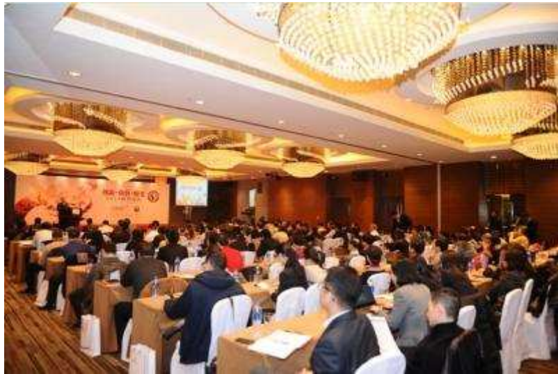
图 19 上海信托召开 2014 财智论坛