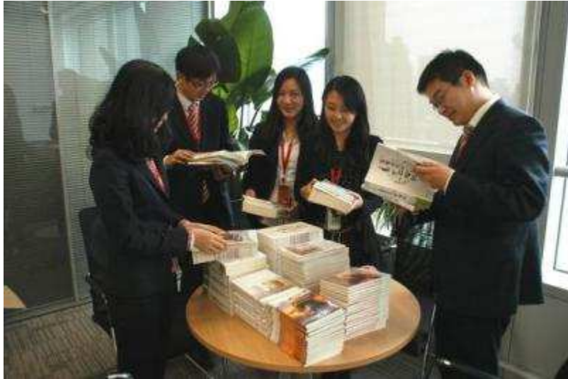
图 12 上海信托团支部每季度为团员青年发放优秀书籍