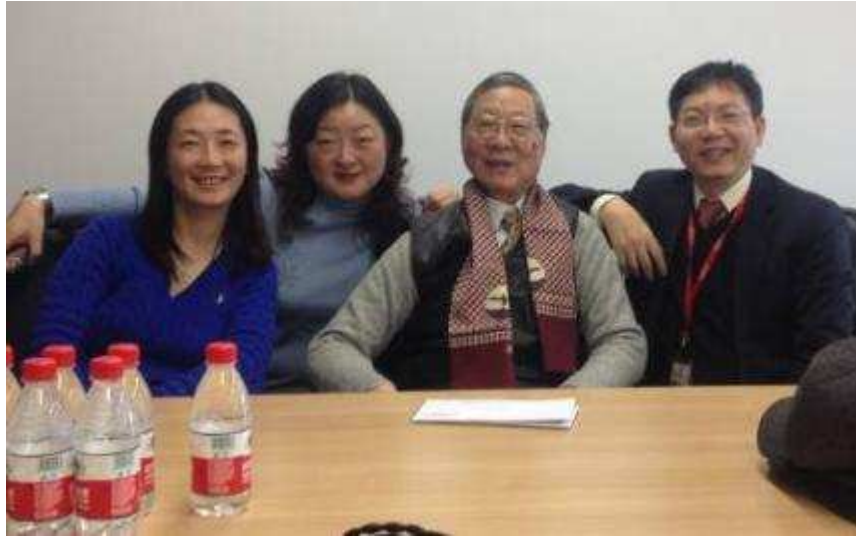
图 32 上海信托慰问退休员工