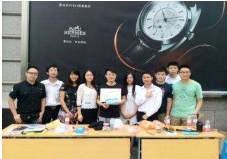
图 37 上海信托参加“沪上新公益·支援鲁甸灾后重建”联合义卖活动

9月2日，外滩街道永安居委党总支向上海信托赠送了一面绣有“真情为民、厚德载福”字样的锦旗，感谢上海信托在永安坊13弄18号发生火灾之后对受灾群众给予的紧急援助。2014年4月15日凌晨，外滩街道永安坊13弄18号突发大火，共造成31户178名居民受灾，给居民造成了严重的经济损失。公司知悉后，立即组织应急慰问金捐赠，帮助受灾居民渡过难关。如今受灾楼宇已修缮一新，受灾居民已全部迁回原址居住，永安居委特借赠送锦旗向上海信托的无私援助给予衷心感谢。公司代表接受了锦旗，并和永安居委党总支书记共同探讨后续共建、帮扶活动安排。今后，公司作为社区党建联建单位将继续履行企业的社会责任，积极开展各类共建、帮扶活动。