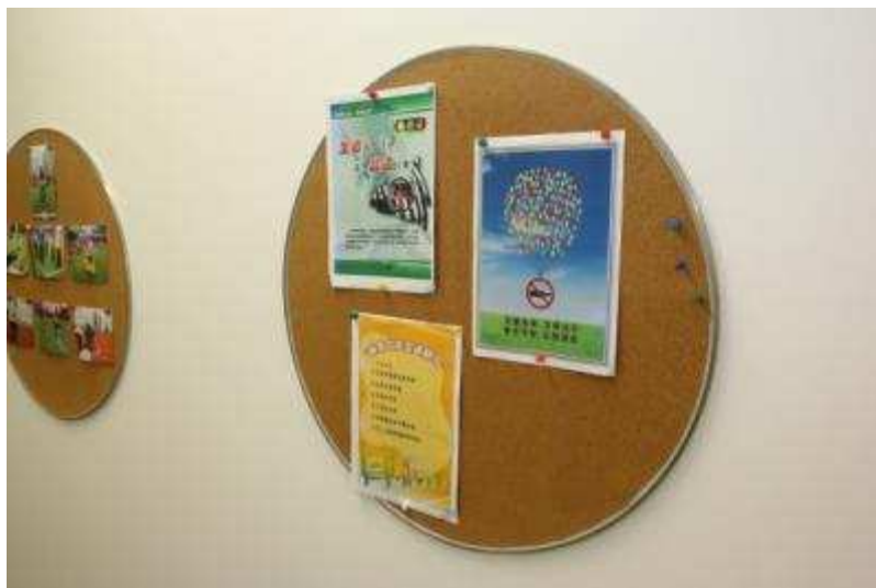
图 14 上海信托开展交通安全倡议宣传活动

9月，上海信托向公司全体员工发出“关爱生命，文明出行”倡议，呼吁员工摒弃交通陋习，并在公司宣传栏张贴了彩色宣传页。公司希望通过此次交通安全宣传活动，在全公司范围内普及交通安全知识，提升安全出行意识。