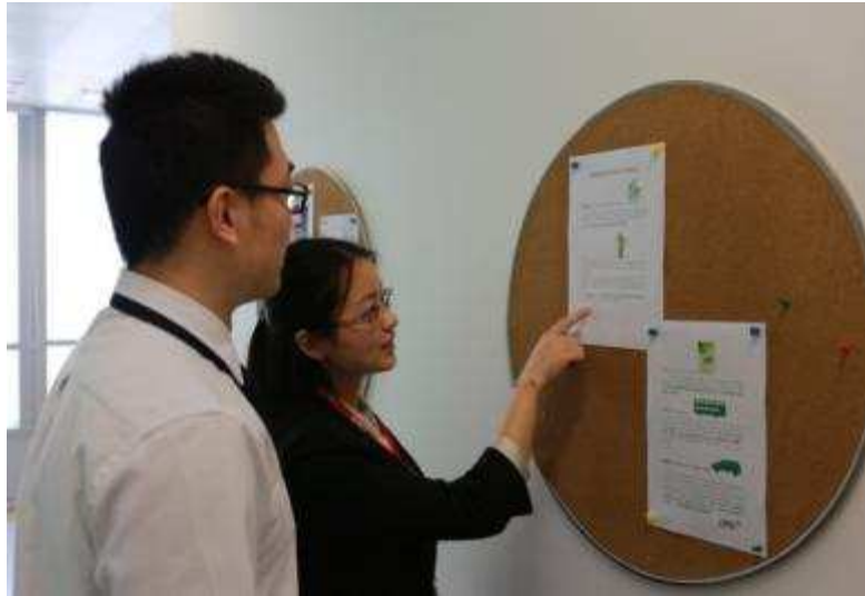
图 43 上海信托开展“低碳生活，绿色出行”倡议活动

工作生活中切实做到降低个人碳足迹、减少个人活动对环境产生的影响，普及碳中和、定制公交、按需出行等绿色出行的新概念、新事物。