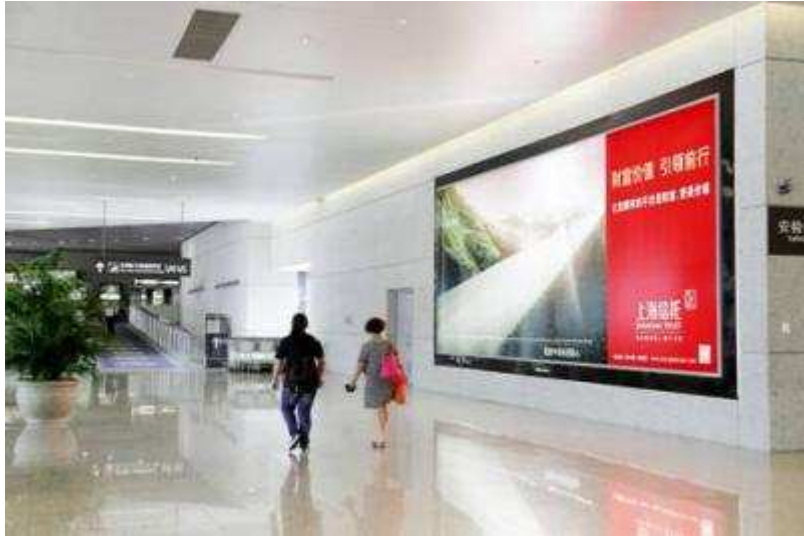
图 22 上海信托在上海虹桥国际机场 T2 航站楼投放平面广告

牌画面以及“家族管理”、“资产管理”和“投资银行”等业务品牌画面，广告主题突出，设计画面大气。系列广告投放后效果显著，已受到客户和同行的高度评价。