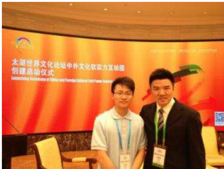
图 36 上海信托志愿者参加太湖世界文化论坛志愿服务活动

6月18、19日，上海信托志愿者参加了第三届太湖世界文化论坛志愿服务活动。论坛以“加强文化软实力互动，促进世界和平与发展”为主题，中外政要、国内外著名学者、中外企业领军人物、媒体人士约五百人出席本届年会。志愿活动在志愿协会的领导下有序的展开，为太湖世界文化论坛的顺利举办提供了支持。