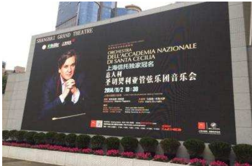
图 30 上海信托独家冠名安东尼奥·帕帕诺与意大利圣切契利亚乐团音乐会

赞助沪上大型活动，树立企业公民形象 公司一直致力于丰富市民文化生活，为促进海内外文化交流持续作出贡献。2014年11月，由上海信托独家冠名的安东尼奥·帕帕诺与意大利圣切契利亚乐团音乐会上海大剧院隆重上演。此次演出是公司第四次与上海大剧院携手，成功举办世界顶级古典音乐演出。