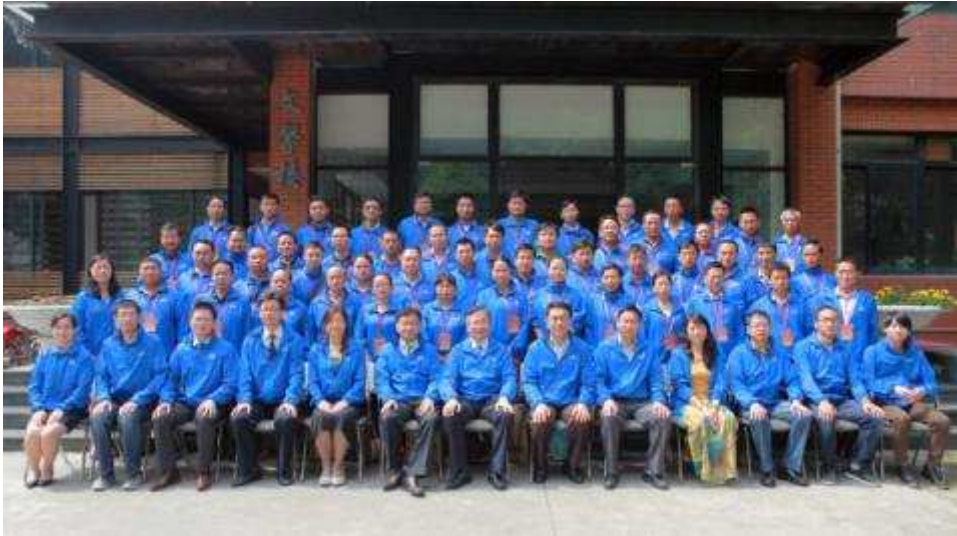
图 29 上海信托“上善”系列云南地区教育助学信托计划

赞助沪上大型活动，树立企业公民形象 公司一直致力于丰富市民文化生活，为促进海内外文化交流持续作出贡献。2014年11月，由上海信托独家冠名的安东尼奥·帕帕诺与意大利圣切契利亚乐团音乐会上海大剧院隆重上演。此次演出是公司第四次与上海大剧院携手，成功举办世界顶级古典音乐演出。