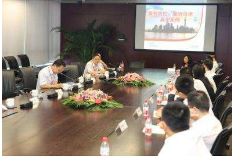
图 27 上海信托纪委开展案件防控典型案例警示教育

2014年8月，上海信托纪委组织公司中层干部开展案件防控典型案例警示教育，播放了《警惕你身边的“融资”人》警示教育片，剖析了业内和近期发生的违规腐败典型案例，并结合公司实际提出了如何进一步做好公司案件防控工作的具体做法和要求。