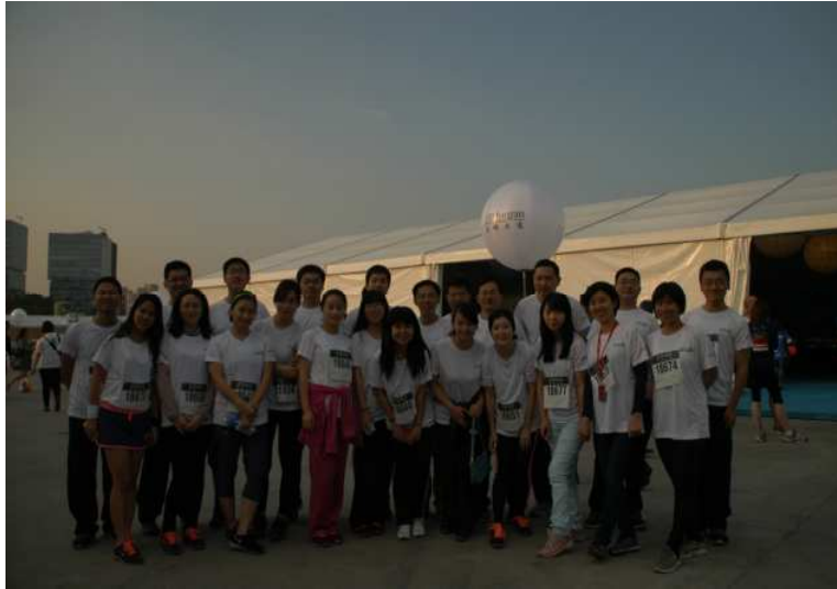
图 10 上海信托参加 2014 年摩根大通企业竞跑赛

营造学习气氛，弘扬中华文化 上海信托的精神文明创建工作以丰富学习内容、扩展知识领域、凝聚团队精神等为着力点和落脚点，推动企业文化和学习型组织建设。上海信托工会在名人商业大厦 21 层、22 层办公区分别设置了阅览区，放置各类图书和杂志供员工取阅。