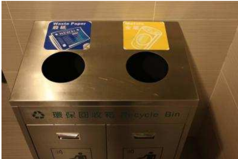
图 44 公司坚持“绿色节能 低碳环保”的经营理念

本报告期内，公司无任何环保违规的负面信息。由于公司为非生产型企业，部分指标无法报告。