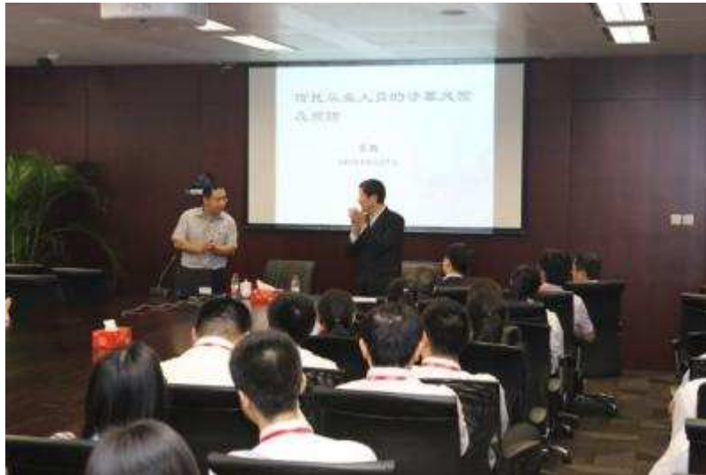
图 28 上海信托主办《信托从业人员的涉罪风险及预防》讲座

继续深化公司反洗钱工作 公司一直坚持履行反洗钱义务，积极履行社会责任，全面贯彻以合规为基础、以风险为导向的反洗钱观念，以预防洗钱活动、维护金融秩序、遏制洗钱犯罪及相关犯罪为宗旨，依据相关法律法规、规章准则的规定和要求，结合信托公司自身情况，建立并逐步完善公司反洗钱工作体系和自律机制，制订并严格执行内控制度和操作流程，认真组织并积极开展反洗钱工作。