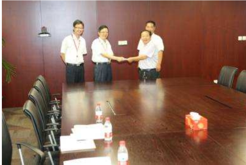
图 34 上海信托接待四团镇、四团村领导一行来访交流

积极参加志愿活动 5月，上海信托志愿者服务队参加了亚信峰会外滩街道平安志愿服务活动。志愿服务活动由上海市社会治安综合治理委员会办公室发起，旨在强化第四届亚信峰会期间的城市安保工作。公司志愿者服务队所展现出的责任意识、专业精神和服务态度获得了现场群众及永安居委工作人员的一致好评，同时，在点滴付出和奉献也不断塑造着员工“服务社会、回报社会”的社会责任意识。