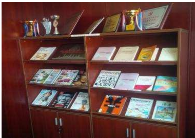
图 11 上海信托图书阅览区

营造学习气氛，弘扬中华文化 上海信托的精神文明创建工作以丰富学习内容、扩展知识领域、凝聚团队精神等为着力点和落脚点，推动企业文化和学习型组织建设。上海信托工会在名人商业大厦 21 层、22 层办公区分别设置了阅览区，放置各类图书和杂志供员工取阅。