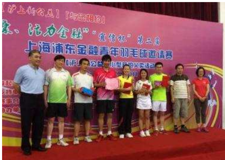
图8 上海信托参加“第二届浦东金融青年羽毛球比赛”

6月，上海信托代表队受邀参加了“第二届浦东金融青年羽毛球比赛”，在全队上下团结一致、齐心协力地共同努力之下，上海信托代表队最终杀出重围获得了团体优胜奖及混双第三名的佳绩，展现出了上海信托人阳光向上、顽强拼搏、团队协作的良好精神面貌。