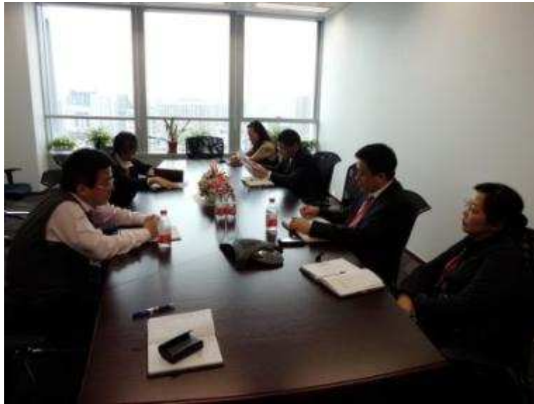
图4 上海信托组织员工学习公民道德建设实施纲要

为配合 2014 年新员工入职培训、帮助新老员工深入理解上海城市精神内涵、加强公司精神文明建设，上海信托开展了上海城市精神教育宣传活动。通过精心制作的上海城市精神宣传彩页，展现出上海城市精神与公司企业文化之间的价值契合点，鼓励新老员工以日常的辛勤工作，参与到创造企业新文化、塑造上海新精神的伟大进程中，在“海纳百川、追求卓越、开明睿智、大气谦和”的城市精神引领下，不断用实际行动，为“信利正，睿见远”的企业品牌宣言注入更加鲜活而持久的生命力。