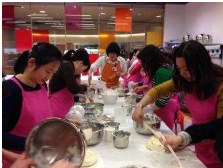
图6 上海信托三八节工会女工活动

2014年3月，为庆祝“三八”国际劳动妇女节，上海信托工会组织女职工开展了西式糕点、寿司的制作学习活动。厨艺学习是女职工们喜闻乐见的活动，既倡导了一种健康的生活方式，又丰富了大家的业余生活，激励大家以更饱满的热情投入到工作中去。