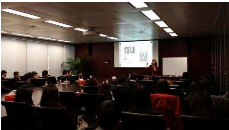
图2 上海信托组织礼仪专题培训

11月，上海信托邀请复旦大学华商研究中心特聘研究员、高级礼仪培训师胡杨教授做题为《当代商务礼仪》的职业培训讲座。胡教授介绍了日常商务中应该具备的仪容仪表、体态形象、礼貌用语、语音语调等，强调年轻人必须内外兼修，始终保持积极向上的心态，才能真正由内而外地透出优雅气质和儒雅的风范。