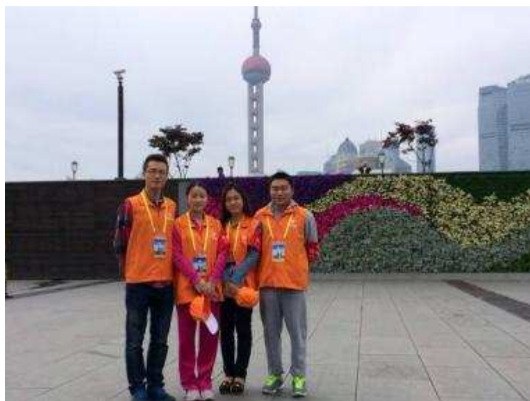
图 35 上海信托志愿者参加太湖世界文化论坛志愿服务活动

积极参加志愿活动 5月，上海信托志愿者服务队参加了亚信峰会外滩街道平安志愿服务活动。志愿服务活动由上海市社会治安综合治理委员会办公室发起，旨在强化第四届亚信峰会期间的城市安保工作。公司志愿者服务队所展现出的责任意识、专业精神和服务态度获得了现场群众及永安居委工作人员的一致好评，同时，在点滴付出和奉献也不断塑造着员工“服务社会、回报社会”的社会责任意识。