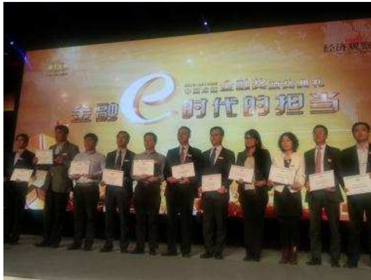
图 24 上海信托荣获 2013-2014 年度中国卓越金融奖·卓越综合服务信托公司奖项