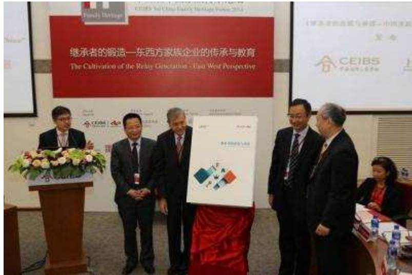
图 21 上海信托发布《继承者的意愿与承诺》白皮书

主动管理能力获得新提升，资产配置结构持续优化 2014 年公司盘活存量固有资产，优化增量资产配置。公司在阶段性低点重点布局流动性和业绩优良的债券基金，在阶段性高点果断兑现存量公司债的账面收益，把握了波段操作的机会。在股票二级市场操作中，公司兼顾低估值蓝筹股票和成长性较好的中小市值股票，在部分股票的差价交易中及时锁定收益，避免了股票投资业绩对自营整体收益的负面影响。同时，公司积极参与重启后的新股网下申购，努力寻找权益类投资新机会。在做好头寸安排、保证固有资金安全性和流动性的前提下，公司以收益率最大化为原则，综合运用现金丰利、货币基金、交易所逆回购和短期协议存款等各类投资工具，有效保障公司资产的流动性。