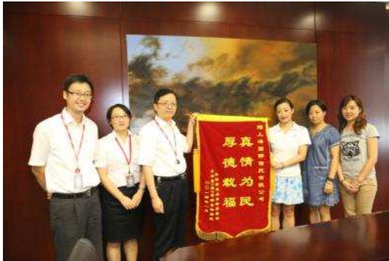
图 38 外滩街道永安居委向上海信托赠送锦旗

9月29日，在祖国的65岁生日来临之际，上海信托青年志愿者参加了公司党建联建社区——永安居委举办的迎国庆升国旗暨社区志愿者宣誓仪式。志愿者们胸配党徽、身着志愿者服，在嘹亮的国歌声中向迎风招展的国旗行注目礼，并祝福祖国繁荣昌盛、国泰民安。随后，志愿者们在社区工作人员的带领下，在国旗下庄严宣誓，决心一如既往尽己所能，践行团结互助的志愿者服务精神，为建设平等友爱、共同前进的美好社会贡献力量。