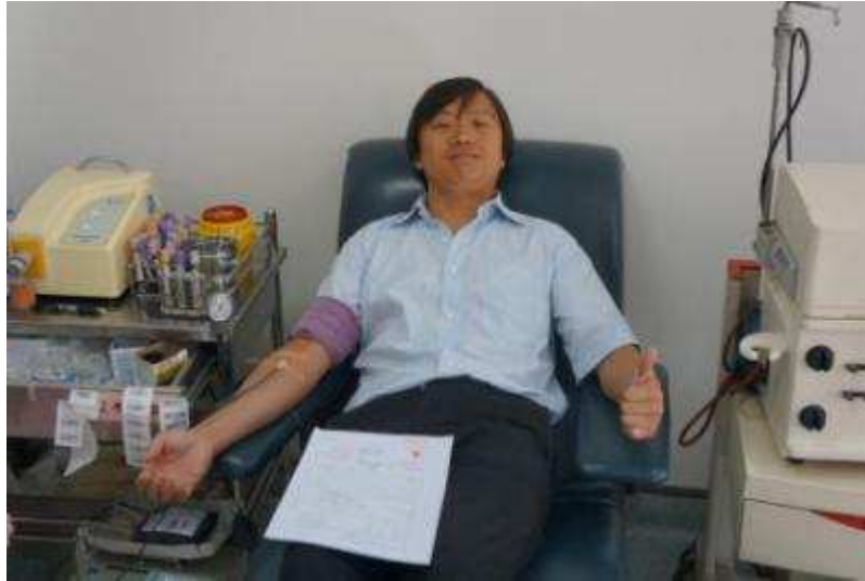
图 41 上海信托员工参与义务献血活动