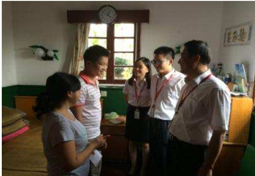
图 33 上海信托慰问双结对助学对象

7月，公司城乡结对帮扶对口镇村——四团镇、四团村领导一行走访上海信托，公司领导、党办成员对来访表示热烈欢迎，并与之进行了积极的交流和会谈。公司领导简要介绍了公司历史、经营发展状况和社会责任工作的基本情况。四团镇方面则向公司提交《四团村结对帮扶材料》，并汇报了双方自2013年12月31日签署结对帮扶协议书以来，结对帮扶工作的落实情况。会谈结束后，公司向村委会捐赠了定向用于60户困难家庭的救助金。