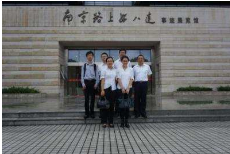
图 39 上海信托各支部代表参观南京路上好八连事迹展览馆