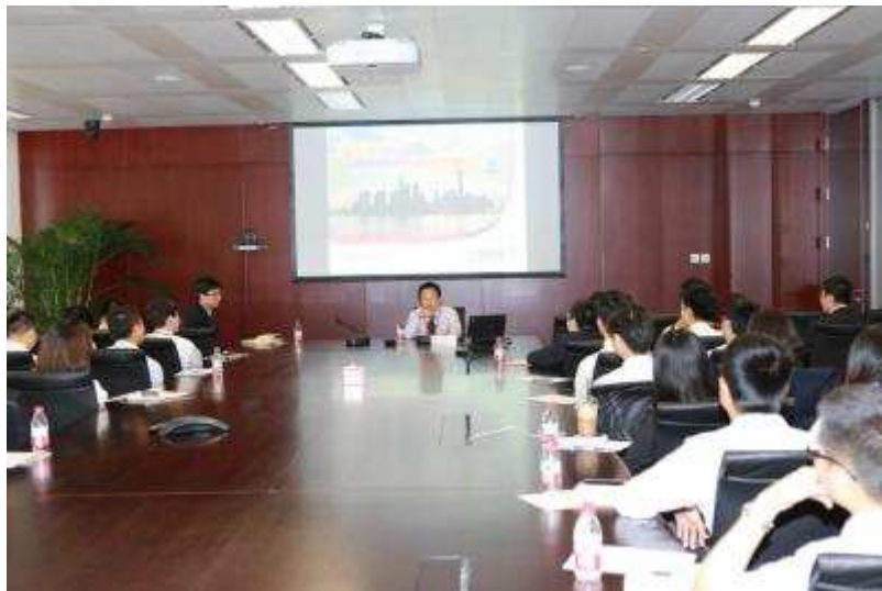
图1 上海信托举办新员工入职培训

拓展员工业务技能 2014年5月，上海信托举办2014年新员工入职培训。公司领导和来自11个业务和管理部门的负责人分别就行业概况、具体业务、展业感悟、公司历史、合规风控、制度流程等进行了介绍和解读。培训采用集中讲授的方式，帮助新员工了解行业和公司基本概况，掌握信托业务基础知识。